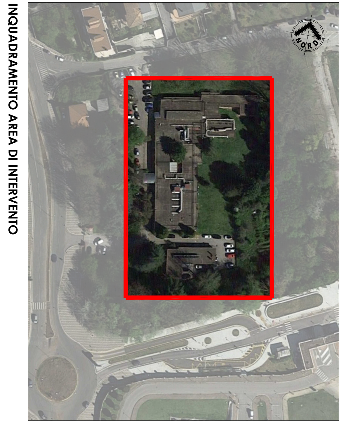
INGUADRAMENTO AREA DI INTERVENTO